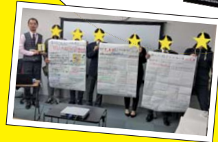
過去の勉強会の様子

とても勉強になりました。お客様目線でチラシをつくることの大切さ、ただ聞くだけではなく、実際にサンプルのチラシを作ることで、より理解が深まりました。